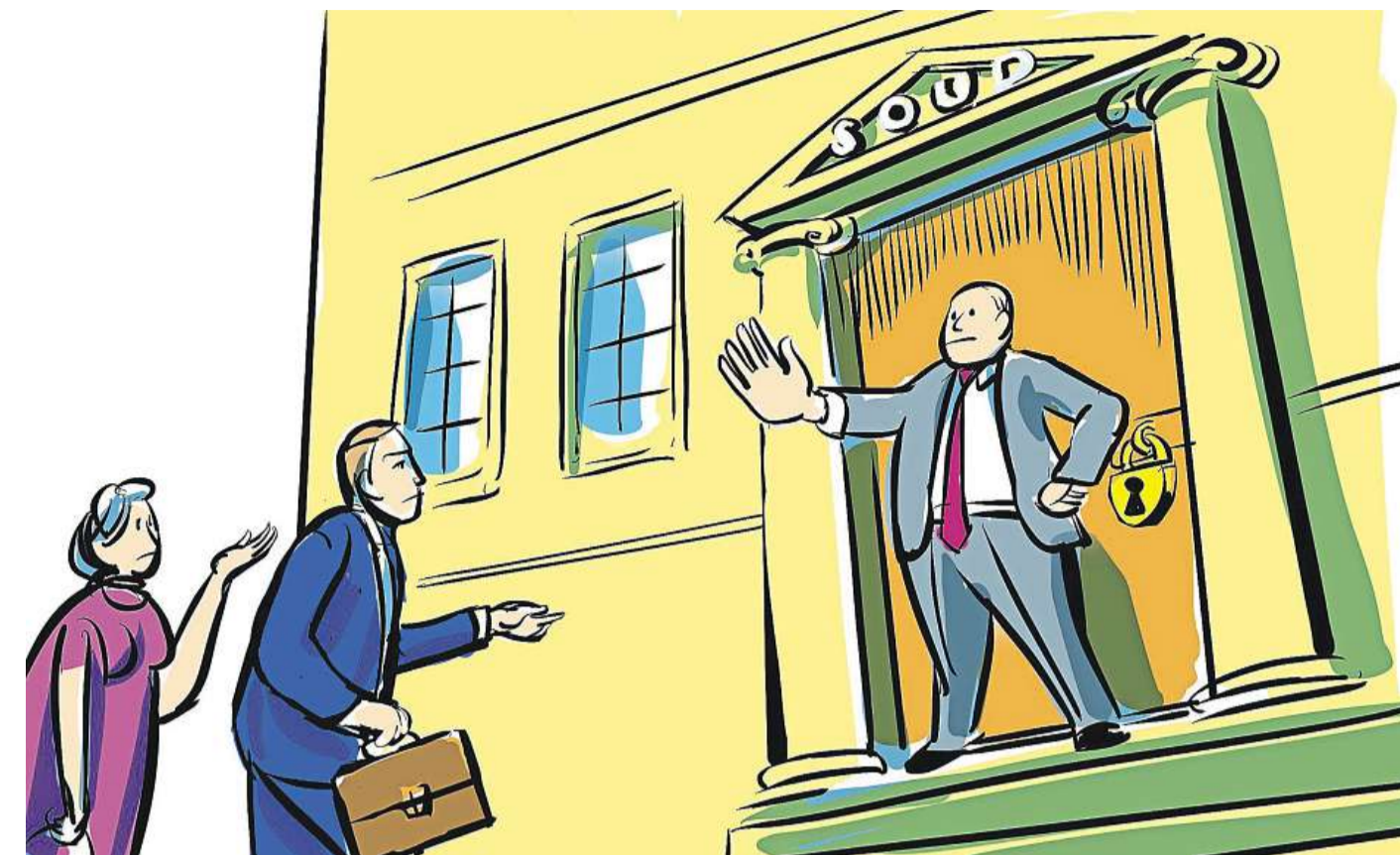
ILUSTRACE RICHARD CORTÉS

Myšlenka nového způsobu veřejné kontroly justice se však zdaleka nezamlouvá každému. „Tato transparentnost za každou cenu může ohrožovat soudcovskou ne-